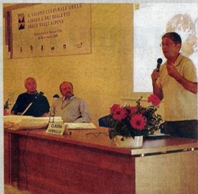
Un momento del convegno di Giazza